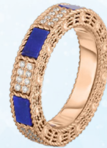
ANEL ART DECO PVP: 4.310.000,00

Pode adquirir qualquer um destes produtos no Centro Private Banking via Crédito em 18 prestações a uma taxa de 18,50 % ao ano. Para mais informações contacta o seu Assessor Financeiro.