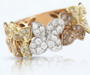
PASQUALEBRUNI ANEL GIARDINI SECRETI PVP: Kz 6.690.000,00

Relojoaria e joalharia exclusivos e de alto padrão.