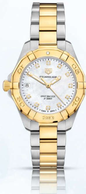
TAGHEUER – WATCH AQPRE QUARTS LY TCCDI DI MOWIT BR 32 PVP: Kz 4.312.500, 00

Veja as horas com estilo e não chegue atrasado a nenhum compromisso.