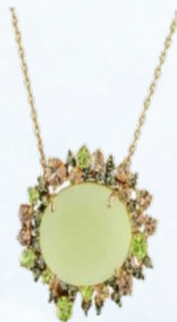
BRUMANI COLAR OA 24 DIAM PVP: Kz 3.549.000,00

Veja as horas com estilo e não chegue atrasado a nenhum compromisso.