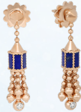
BRINCOS ART DECO PVP: Kz 11.565.000,00