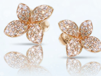
BRINCOS PETIT GARDEN PVP: Kz 6.145.000,00

Pode adquirir qualquer um destes produtos no Centro Private Banking via Crédito em 18 prestações a uma taxa de 18,50 % ao ano.