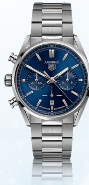
TAGHEUER-CHRG CARRE AUTO MN STE BLUE BR ST 42 PVP: Kz 6.842.500,00

Pode adquirir qualquer um destes produtos no Centro Private Banking via Crédito em 18 prestações a uma taxa de 18,50 % ao ano.