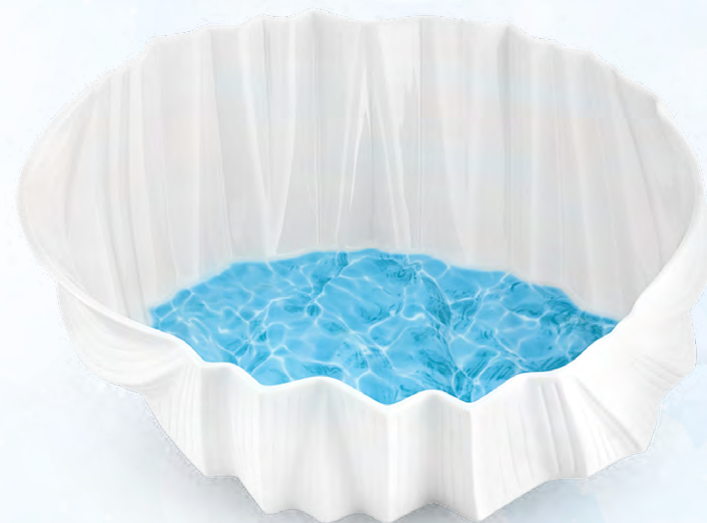
CENTRO DE MESA CARAVELA