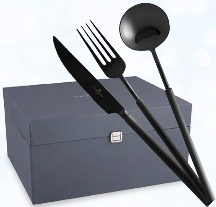
ESTOJO 130 PEÇAS DOMO MATT BLACK (TALHERES)