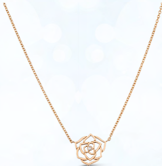
PIAGET ROSE PENDANT RG DIA PVP: Kz 8.687.500,00