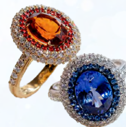
DAVITE & DELUCCHI – GIOIELLI ANEL DOURADO OVAL COM DIAMANTES PVP: Kz 6.272.160,00