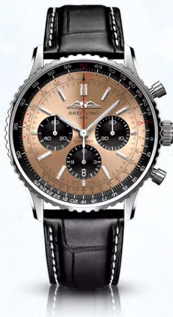
BRT NAVITIMER B01 CHRONO 43 BRN LBLK FC PVP: Kz 10.450.000,00