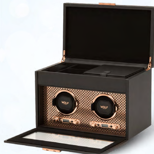
WOLF - AXIS DOUBLE WINDER W/ STORAGE PVP: Kz 1.930.800,00