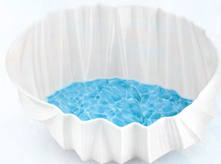
CENTRO DE MESA CARAVELA PVP: Kz 1 368 045,00

Adquira estes produtos no seu Private Banking. Crédito em 18 prestações a uma taxa de 18,50% ao ano. Para mais informações contacte o seu Assessor Financeiro.