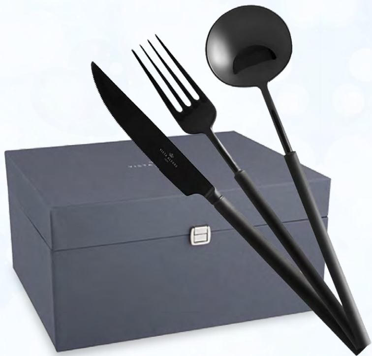
ESTOJO 130 PEÇAS DOMO MATT BLACK (TALHERES) PVP: Kz 4 563 044,38