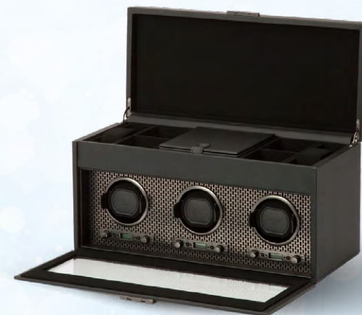
WOLF - AXIS TRIPLE WINDER W/ STORAGE PVP: Kz 2.898.000,00

Adquira estes produtos no seu Private Banking. Crédito em 18 prestações a uma taxa de 18,50% ao ano. Para mais informações contacte o seu Assessor Financeiro.