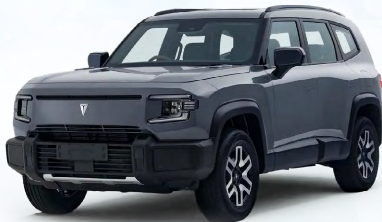
DEEPAL G318 | HÍBRIDO | GASOLINA PVP: Kz 45.990.000,00

Contrate o Crédito Automóvel e adquira esta viatura no seu Centro Private Banking. Crédito em 60 prestações a uma taxa de 20,50 % ao ano. Para mais informações contacte o seu Assessor Financeiro.