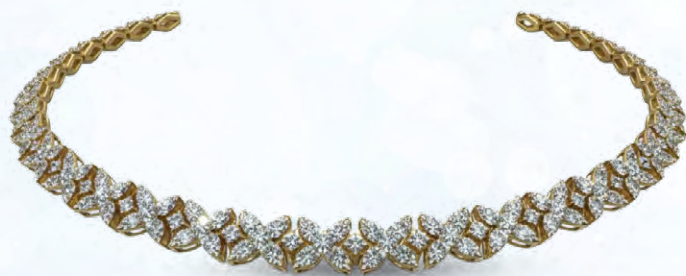
DAVITE & DELUCCHI – GIOIELLI COLAR PÉTALAS COM DIAMANTES PVP: Kz 38.396.400,00