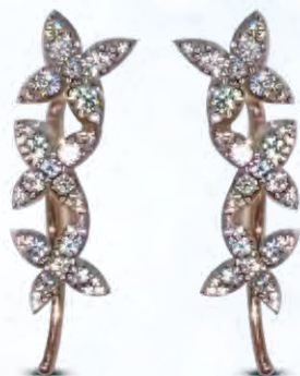
DAVITE & DELUCCHI – GIOIELLI BRINCOS PÉTALAS COM DIAMANTES PVP: Kz 7.192.944,00