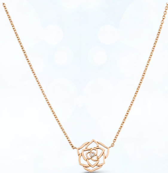
PIAGET ROSE PENDANT RG DIA PVP: Kz 8.687.500,00