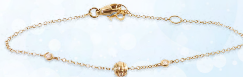
PIAGET- BRACELETE POSSESSION CLASSIQUE RED G DIA PVP: Kz 2.450.000,00

Adquira estes produtos no seu Private Banking. Crédito em 18 prestações a uma taxa de 18,50% ao ano. Para mais informações contacte o seu Assessor Financeiro.