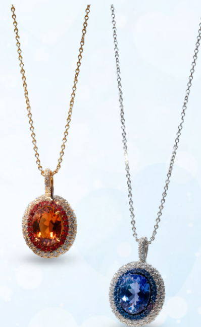
DAVITE & DELUCCHI – GIOIELLI COLAR DOURADO OVAL COM DIAMANTES PVP: Kz 6.470.640,00

Adquira estes produtos no seu Private Banking. Crédito em 18 prestações a uma taxa de 18,50% ao ano. Para mais informações contacte o seu Assessor Financeiro.