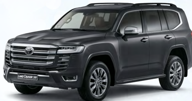
TOYOTA LAND-CRUISER 300 3.3 AUT GR-S PVP: Kz 145.500.000,00

Contrate o Crédito Automóvel e adquira esta viatura no seu Centro Private Banking. Crédito em 60 prestações a uma taxa de 20,50 % ao ano. Para mais informações contacte o seu Assessor Financeiro.