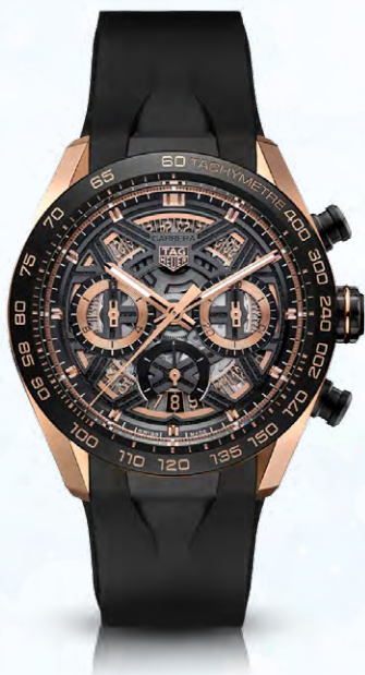
WATCH CAR CHR 44 GLD/TI PLT/BLK BRA RUB PVP: Kz 17.946.500,00